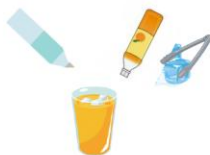
簡単な飲料の調製