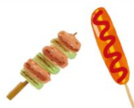
焼き鳥・フランクフルトなど 直前加熱のもの